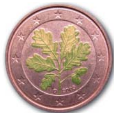
25. - 27. NOVEMBER 2011 DRESDNER HOCHSCHULTAGE ÖKOLOGISCHE UND SOZIALE MARKTWIRTSCHAFT

Die Veranstaltung richtet sich vor allem an Studierende aber auch an die breite Öffentlichkeit und geht den Fragen nach, wie wir konkret etwas im Klimaschutz bewegen können und wo wir anfangen sollen. Am Freitag, den 25. November um 17 Uhr startet die Veranstaltung mit der Podiumsdiskussion „Mythos Grünes Wachstum - Führt mehr Effizienz in die Zukunft oder nur auf Umwegen zum Abgrund?“ Teilnehmer